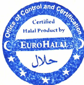
M'hamed EL AKILI Beheerder-adviseur

EuroHalal – Office of Control and Halal Certification – Asbl - Vzw Bld. Barthélémy, 20 B- 1000 Brussels - Belgium.