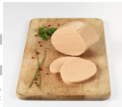
Suggestion de présentation